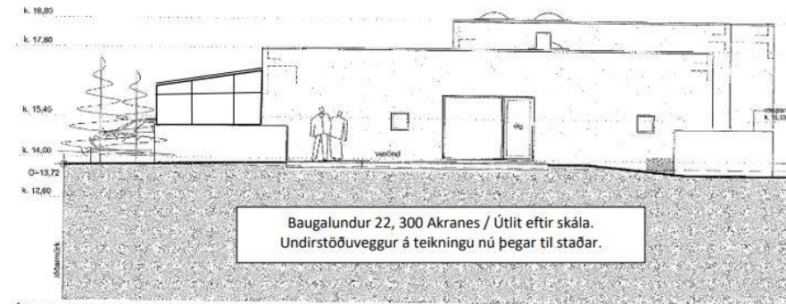
ÚTLIT SUÐUR M 1 : 100