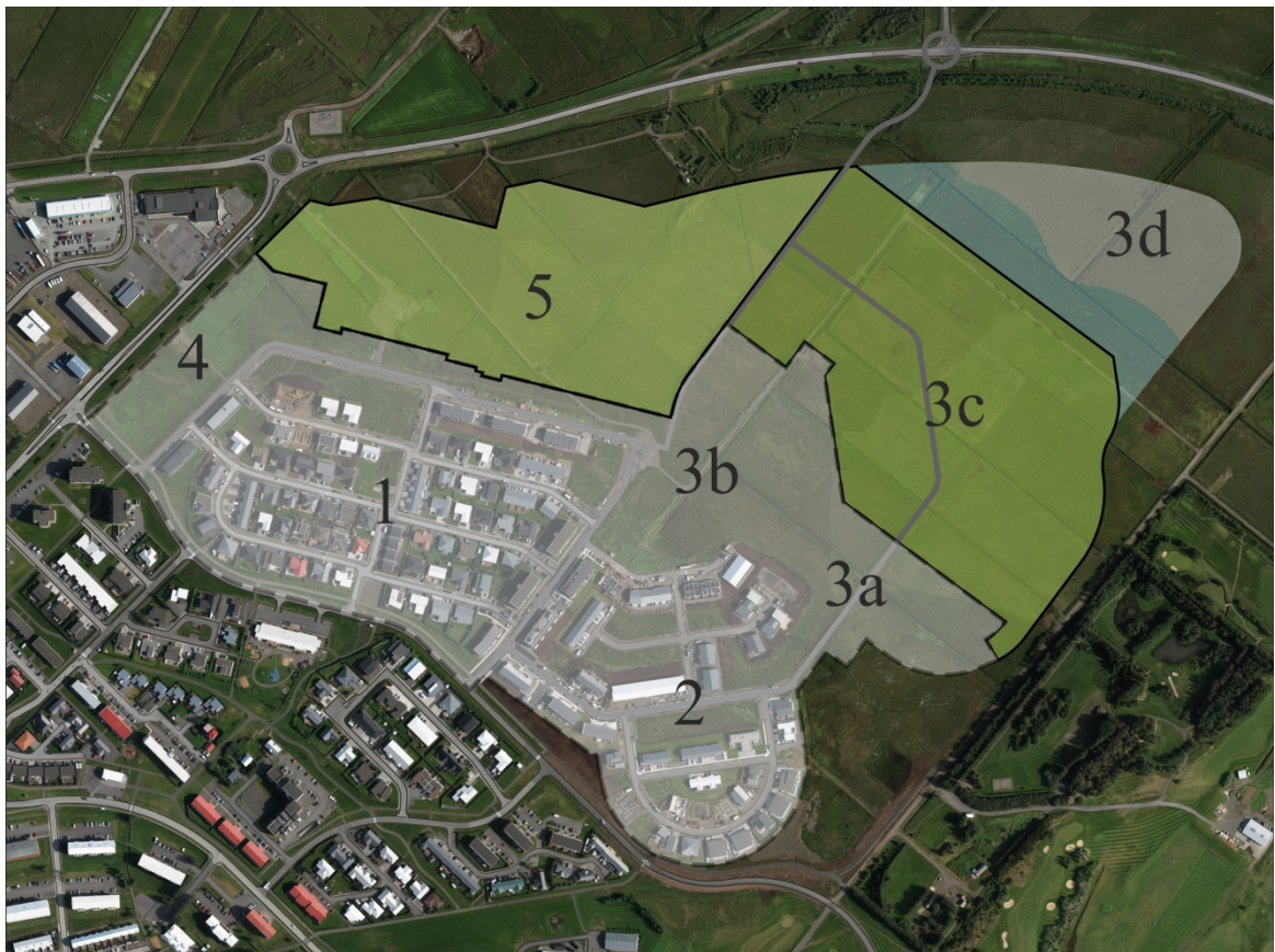
Mynd 1: Skipulagsáfangar Skógahverfis.