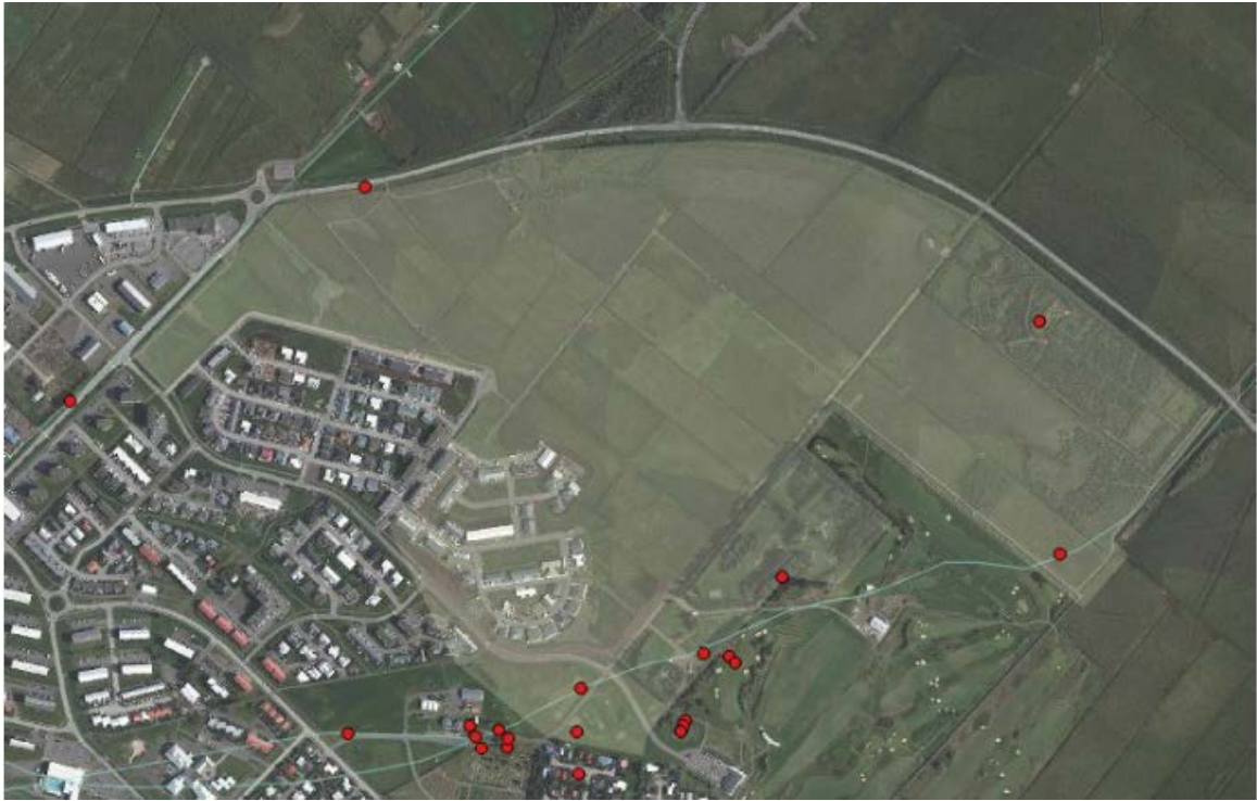
Mynd 2: Skráðir minjastaðir í Garðaflóa (rauðir punktar) Adolf Friðriksson, Deiliskráning fornleifa í Skógahverfi, 2020.

Skipulagssvæði í Garðaflóa sunnan Þjóðvegur var kannað m.t.t. fornleifa á síðasta ári. Fyrir liggur s.k. deiliskráning fornleifa fyrir svæðið. 1 Við skráningu á vettvangi komu fram fimm minjastaðir innan skipulagsreits og 14 aðrir skammt utan reits. Engar minjar fundust á fyrirhuguðum framkvæmdasvæðum innan skipulagsreitsins.