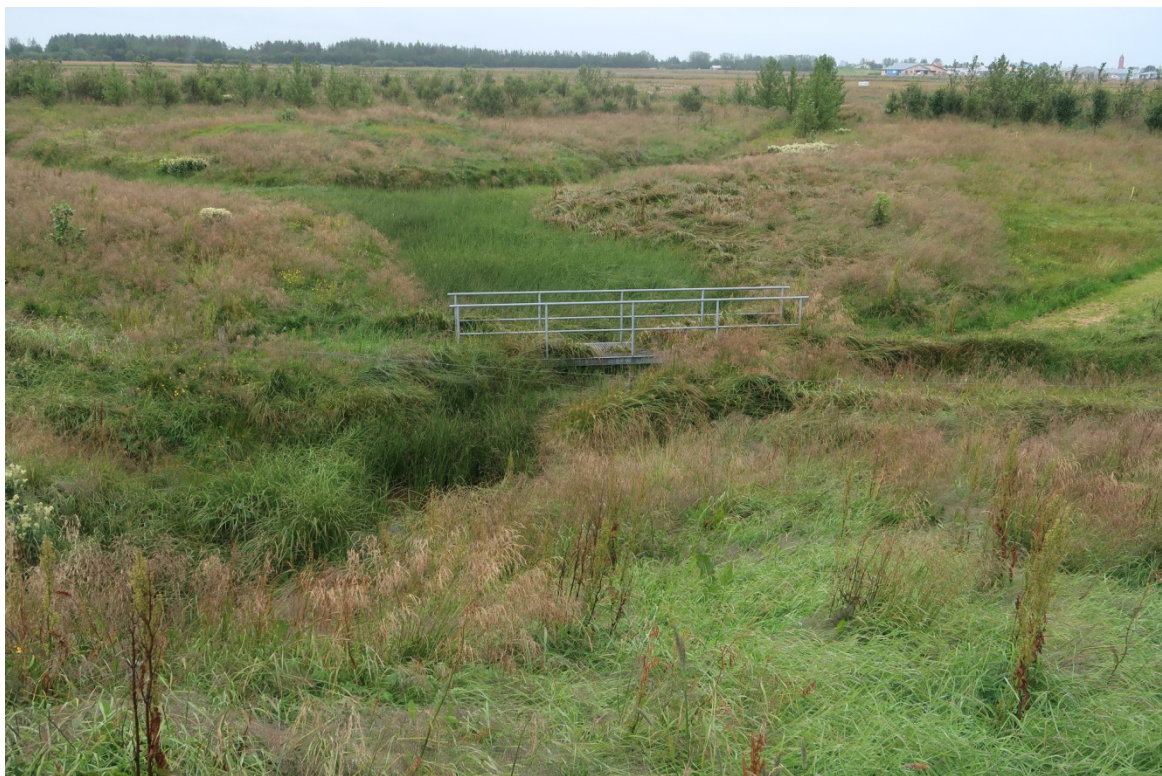
Mynd 4: Miðvogslækur sunnan Þjóðvegjar. Horft til suðurs að 3. áfanga Skógahverfis.