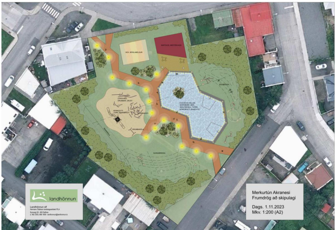
Yfirlitsmynd, skipulag Merkurtúns, völlur sem tjörn.