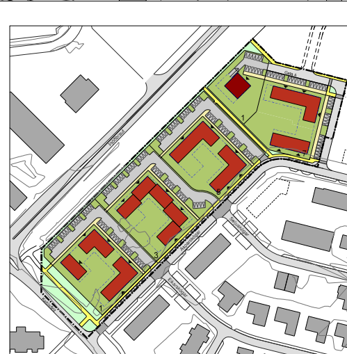
SKÝRINGARUPPDRÁTTUR MKV. 1:2.000

Gildistaka deiliskipulagsins var auglýst í B-deild Stjórnartíðinda _____