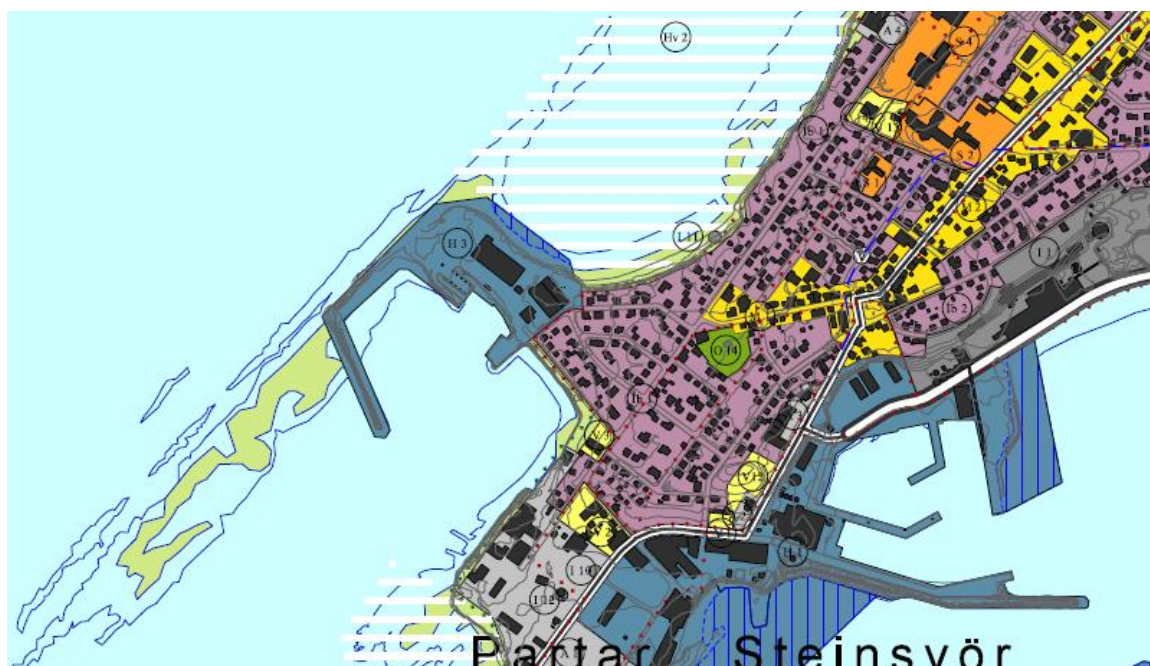
Mynd 2: Aðalskipulag Akraness 2005-2018 m/breytingum.