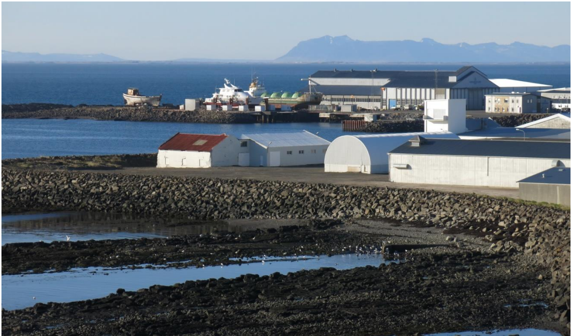
Mynd 5: Horft að dráttarbrautinni úr Akranesvita 2017.

Skipulagslýsing verður send umsagnaraðilum, kynnt með auglýsingum í blöðum og dreifiritum, á vef Akraneskaupstaðar http://www.akranes.is/ og verða aðgengileg í þjónustuveri Akraneskaupstaðar að Stillholti 16-18. Á kynningartíma verður almenningi og umsagnaraðilum gefinn kostur á að koma með ábendingar og sjónarmið um fyrirhugaðar breytingar. Þær skulu vera skriflegar og sendar á þjónustuver Akraneskaupstaðar Stillholti 16-18 eða á netfangið skipulag@akranes.is , merkt Grenjar – skipulag . Kynningartími og skilafrestur ábendinga kemur fram í auglýsingu og á vefsíðu Akraneskaupstaðar.