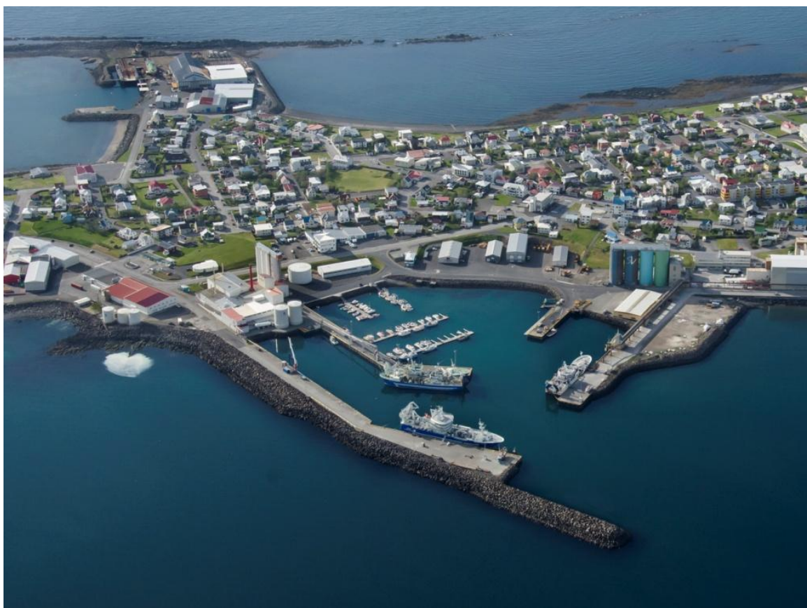
Mynd 1: Akraneshöfn. Hafnarsvæðið á Grenjum fjær – milli Lambhúsasunds og Krókalóns.

Með framlagningu og kynningu lýsingar í upphafi verks er umsagnaraðilum, hagsmunaaðilum og almenningi gefinn kostur á að leggja fram sjónarmið og ábendingar sem að gagni gætu komið við skipulagsvinnuna áður en gengið verður frá breytingartillögum til afgreiðslu og auglýsingar.