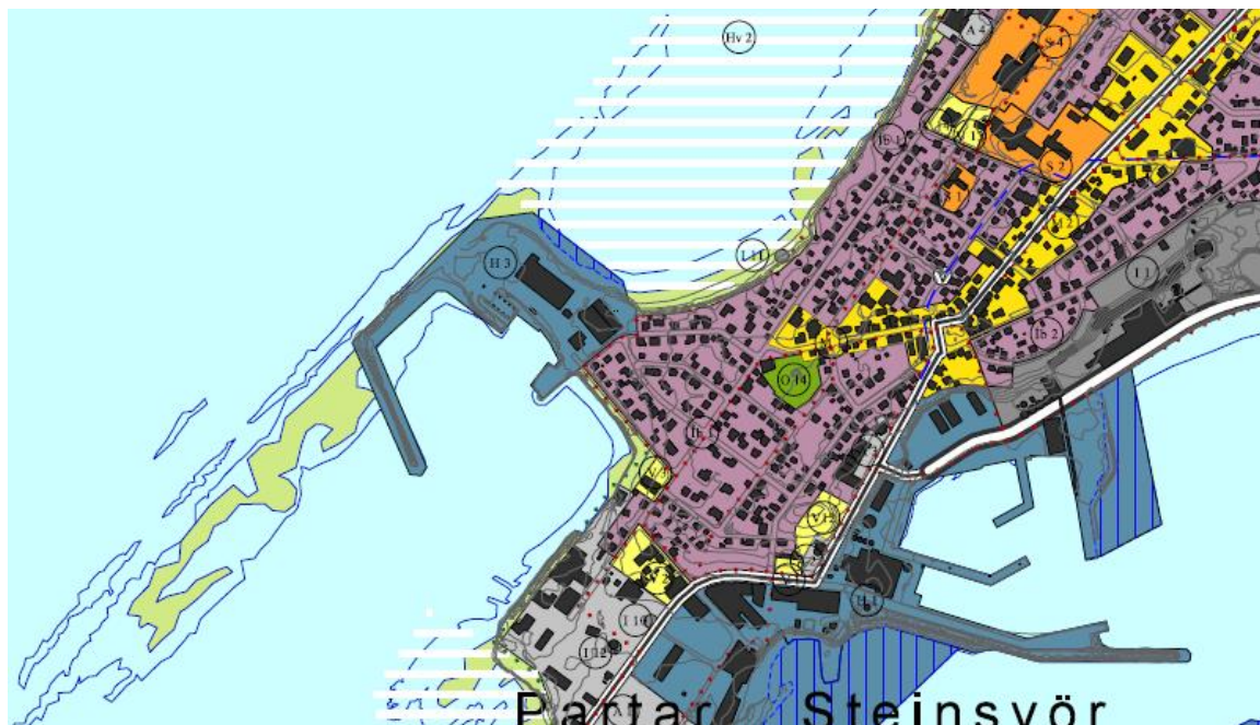
Mynd 2: Aðalskipulag Akraness 2005-2018 m/breytingum.