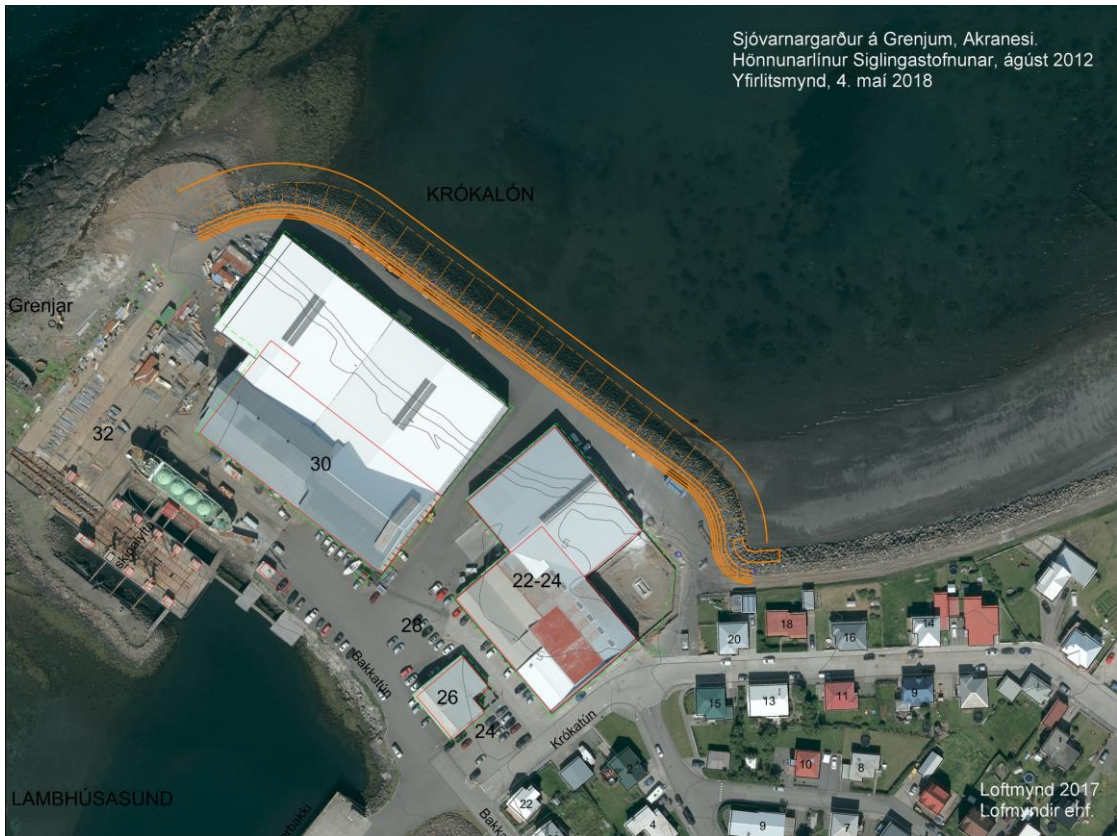
Mynd 2. Hönnunarlínur Siglingastofnunar frá ágúst 2012 sýndar á loftmynd frá 2017.