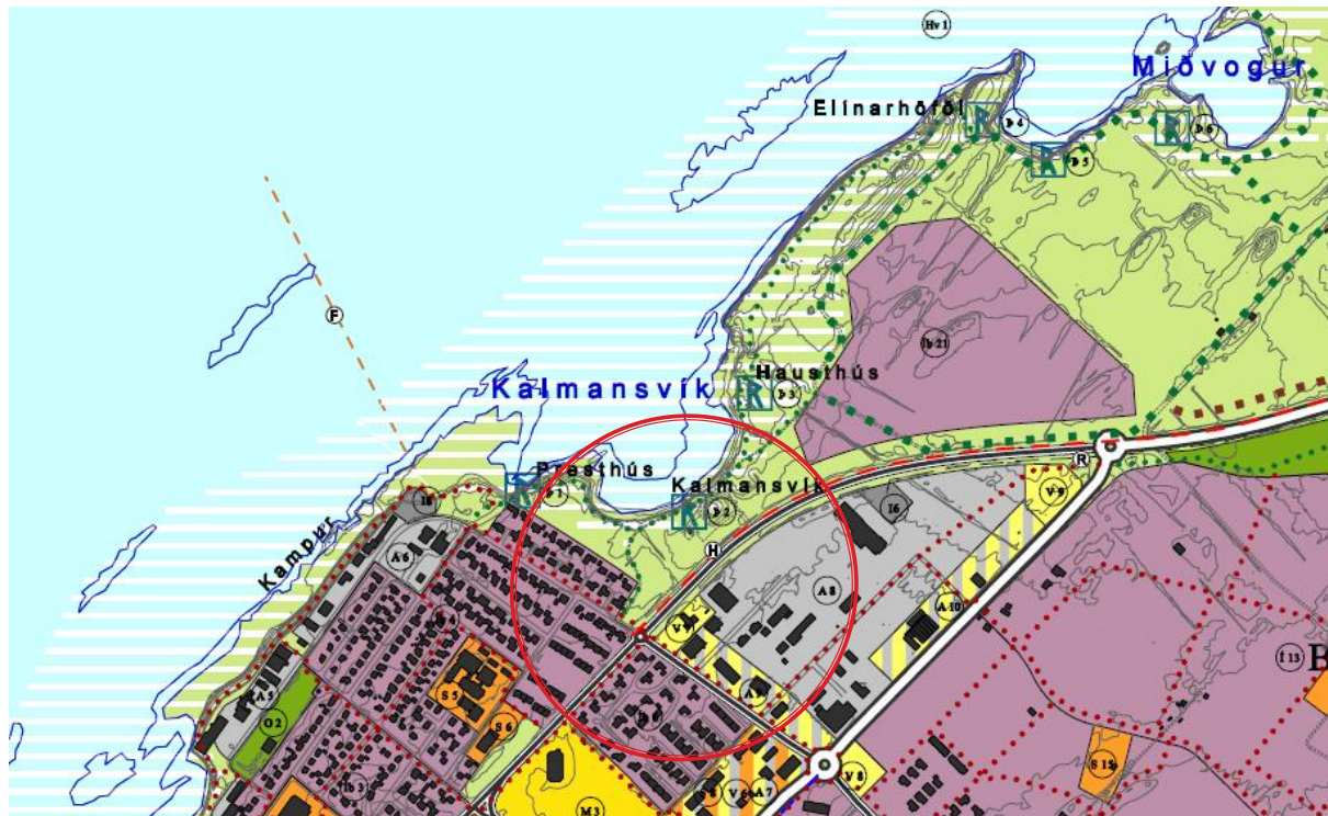
Mynd 1: Aðalskipulag Akraness 2005–2017. Rauður hringur dreginn um svæðið sem breytingin á við.

Mörk hverfisverndar verða dregin með meiri nákvæmni en gert er á gildandi aðalskipulagsupprætti og munu miðast við sjóvarnargarð og gangstíg.