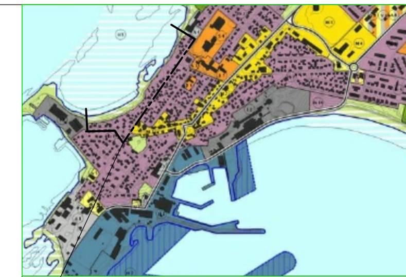
HLUTI ÚR AÐALSKIPULAGI AKRANES

GERÐ OG STÆRDIR BYGGINGA SKV. UPPLÝSINGUM FRÁ FASTEIGNAMATI RÍKISINS