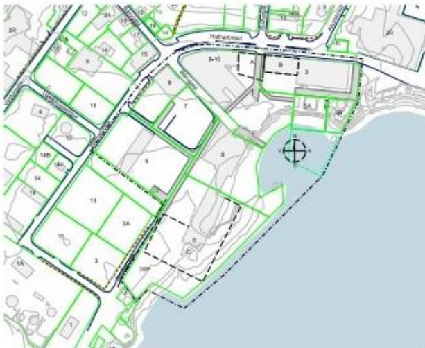
BREYTTUR HLUTI DEILISKIPULAGS - 1:2000

Vegna þessa áformu er sálgjafar byggjagættir fyrir fyrirkjæpa viðbyggingu við niðverndi höfnarvæðis. Þessi byggjagættir lenda á tvöum lóðum, eða Breiðargata 10 og 8B. Vegna þessa er lóðarmark Breiðargata 30 breytt þannig að sú lóð er niðverndi höfnarvæðis lóðarmark í suðri með 10 og 8B er drögn frá vestri í þessu stöðu sem þau eru til við-loftans. Breiðargata 8B er svo stökkuð um þannan hluta sem til felur við þetta. Lofthæfir er lóð Breiðargata 8B stökkuð til suðvestar þannig að því lóð endir fyrirkjæpa byggjagættir, auk loftstæða. Laga þarf grótsamgættir umma og súbstant fyrirkjæpa byggjagættir og landfylla endir fyrirkjæpa byggjagættir svo svo af þessu byggjagættir fær ágætt sjóvar. Landfylling þessi er sammen við fyrirkjæpa landfyllingu í deiliskipulagi. Þreytt er um lóðarmark á Breiðargata 8B sem verður samkvæmt lóðarmark Breiðargata 6 og lóðarmark Breiðargata 30 breytt og verður Breiðargata 6.