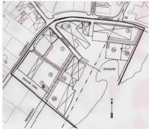
GILDANDI DEILISKIPULAG - 1:2000 Stv. teikning nr. 5110, daga: 18.2.2004 Samþykkt í bæjarþingi Akranes, daga: 25.11.2003