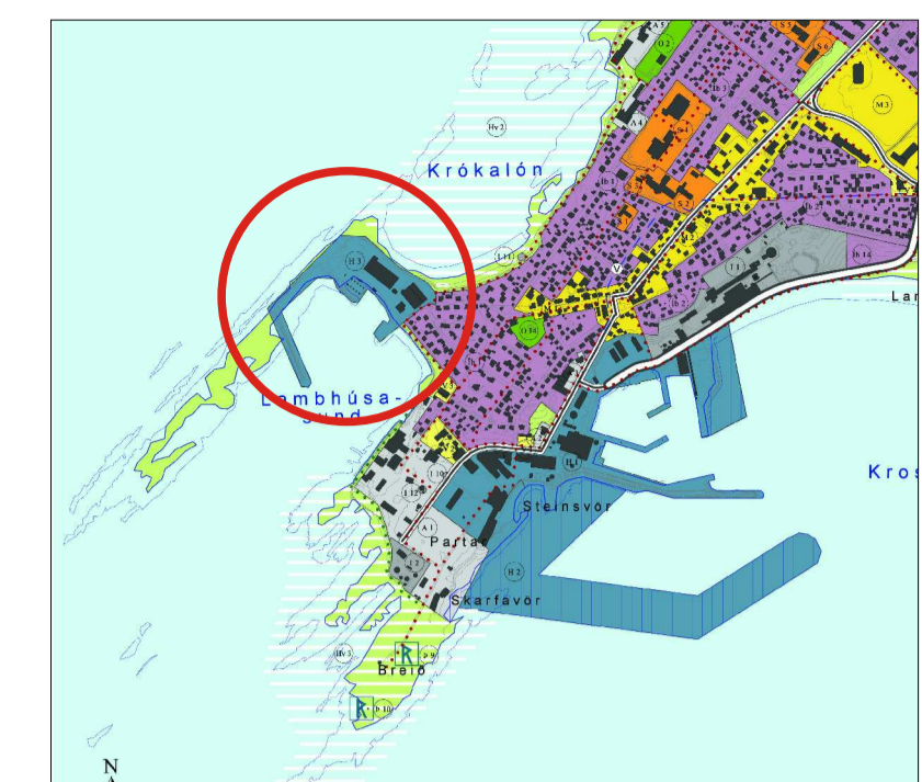
Hluti úr aðalskipulagi Akraness 2005-2017 (ekki í kvarða)