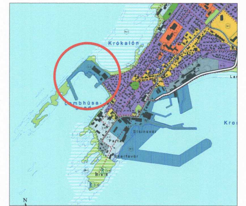
Hluti úr aðalskipulagi Akraness 2005-2017 (ekki í kvarða)