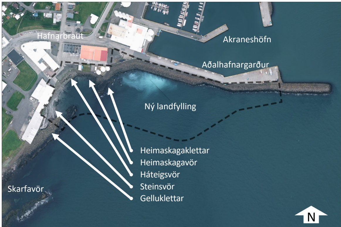
Mynd 2: Afmörkun skipulagssvæðis sýnd á loftmynd frá 2021.

Klappirnar sitt hvorum megin við vikina eru eina ósnerta landið innan skipulagssvæðisins. Byggingar og sjóvarnargarðar ná alls staðar fram á sjávarklappirnar. Neðar (sunnar) eru Sýrupartsklettur og Skarfavör sem er innan hverfisverndarsvæðis.